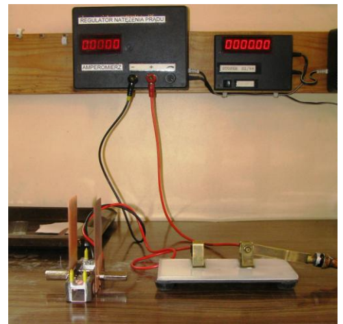
Rys. 1 Obwód pomiarowy do wyznaczenia wartości równoważnika elektrochemicznego.

Foto. Sposób umocowania elektrod i dołączenia przewodów do zasilacza oraz do wyłącznika